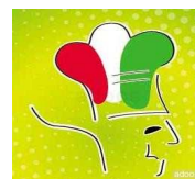
CAMARIERI PIZZA PARTY www.camarieri.com.ar